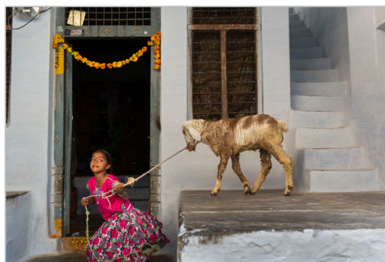
Una niña juega con un cordero en Bukaraya Samudram durante la festividad del Teru.

La muestra ahonda en lo más sensible y mágico del mundo femenino y en la fuerza y la capacidad de superación de las mujeres de Anantapur. La fotógrafa se ha acercado a ellas con un respeto reverencial. Obstinada y desmedida, Cristina García Rodero ha sabido sumergirse en ese mundo, fundirse en la alegría y sufrimiento de quienes encubren con color y apostura los claroscuros de su propia existencia.