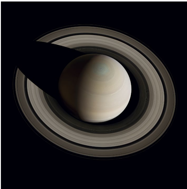
Por encima del polo norte de Saturno, fotografía compuesta en mosaico. Cassini, 10 de octubre de 2013.