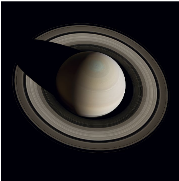
Por encima del polo norte de Saturno, fotografía compuesta en mosaico. Cassini, 10 de octubre de 2013.