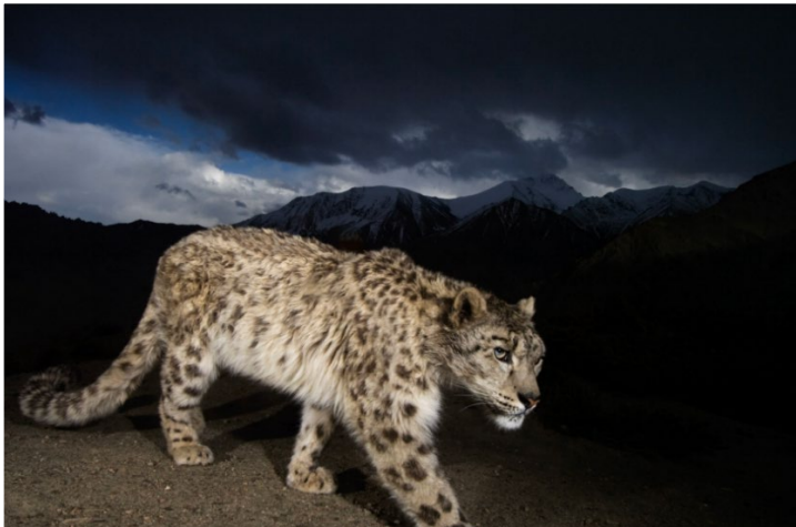
Parque Nacional de Hemis, Ladakh, India.

El fotógrafo Steve Winter necesitó 13 meses, mucha pericia y algo de suerte para lograr immortalizar al esquivo leopardo de las nieves gracias al uso de cámaras trampa. Una foto de esta serie ganó en 2008 el primer premio del prestigioso certamen Wildlife Photographer of the Year .