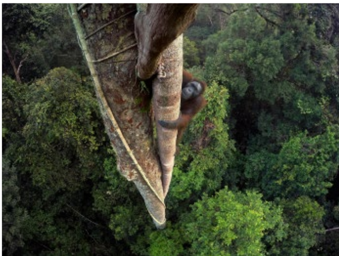
Kalimantan, Borneo, Indonesia.

A 30 metros del suelo, este orangután de Borneo trepa en busca de unos preciados higos. Los orangutanes crean un mapa mental de la selva, y recuerdan cuándo y dónde encontrar fruta madura. Indonesia pierde cada año miles de hectáreas de sus bosques tropicales debido a la tala y a las plantaciones de palma aceitera, lo que pone en peligro la supervivencia de estos animales.