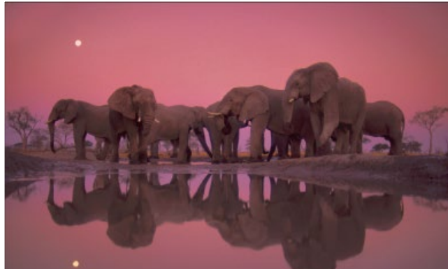
Parque Nacional de Chobe, Botsuana.

Los elefantes juegan un papel crucial en los ecosistemas de sabana y bosque. La caza de estos animales para abastecer la demanda de marfil en Asia ha diezmoado sus poblaciones hasta extremos dramáticos. Un tercio de los elefantes de África vive en Botsuana.