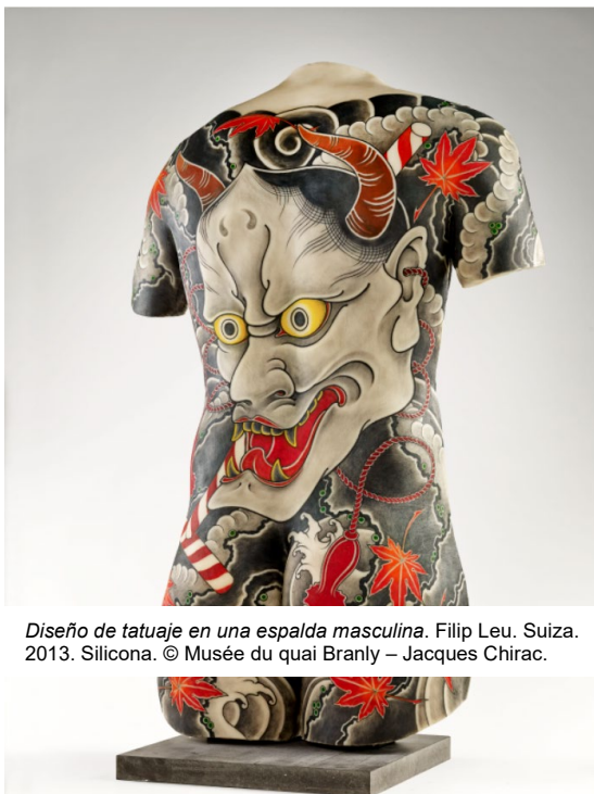
Diseño de tatuaje en una espalda masculina. Filip Leu. Suiza. 2013. Silicona. © Musée du quai Branly – Jacques Chirac.

Cuando el Musée du Quai Branly - Jacques Chirac inició su andadura con esta exposición en París en 2014, invitó a los tatuadores más eminentes del momento a realizar una obra sobre réplicas de silicona de distintas partes del cuerpo. Posteriormente, en cada etapa de su itinerancia por todo el mundo, la muestra se ha ido enriqueciendo con nuevas obras encargadas a tatuadores de distintas nacionalidades, desde tatuajes tradicionales hasta novedosas creaciones.